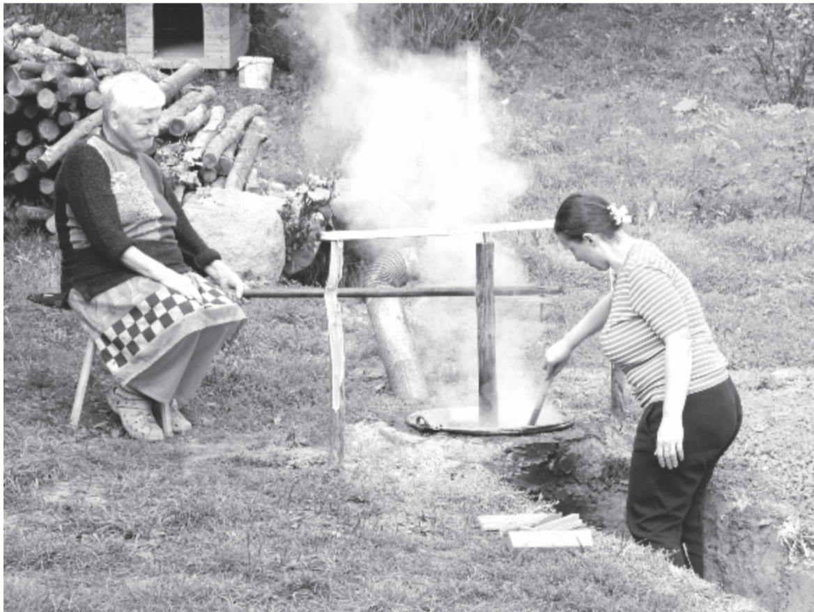
Lekvárfőzési idény – idős és fiatal ezzel foglalkozik most

A család úgy érzi, termelői tevékenységükben a legnagyobb akadály ma a bürokrácia, míg a legnagyobb sikernek azt tartja, hogy Szlovákiában lekvárral nagyaranyat, borral ezüstérmét szereztek, viszont sikerélmény számukra minden vásárlói visszajelzés is, ami azt bizonyítja, izletes volt a termék, és még szívesen vásárolnának belőle.