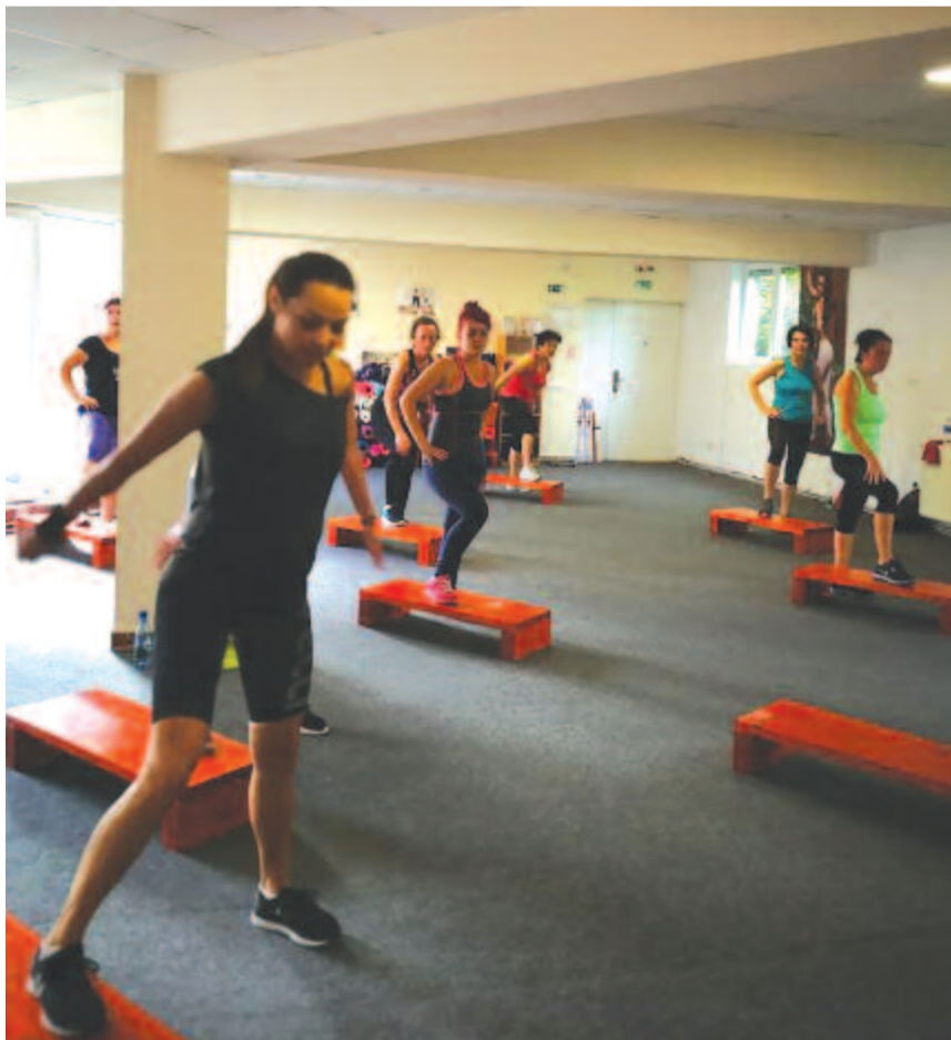
Pillanatkép az egyik edzésről

– A havi tandíj mellett semmilyen kellékre nem kell pluszban fizetni, hiszen a botok már megvannak, más felszerelésre nincs szükség egy kényelmes sportszeren kívül. A marosvásárhelyi Avram Iancu Iskolaközpont (a volt MIU ipari liceum) szomszédságában lévő teremben mindennap reggel 8-tól, délután 5-től, este 6-tól és 7-től, valamint szombat reggel 8-tól tartunk egyórás edzéseket. Induláskor egy-két érdeklődő volt, aztán ötven lettek, most pedig már hetven bérletes személy látogatja az edzéseinket.