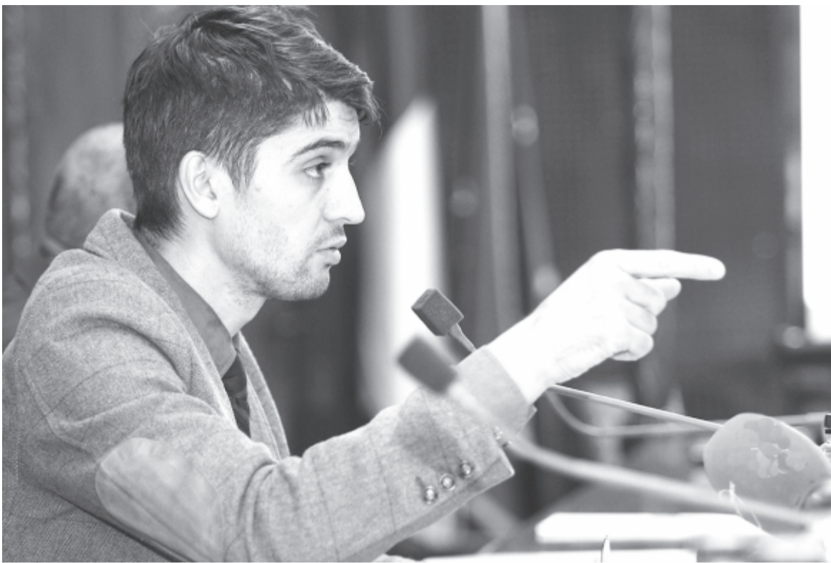
Veaceslav Şaramet államtitkár

Miközben a külföldön munkát vállaló pórul járt áldozatokról forgott a megdöbbentő képsorokat tartalmazó kisfilm, Nagy Zsigmond alprefektus kiemelte, hogy hangsúlyozottan felhívják azon személyek figyelmét, akik külföldi munkavállalásra készülnek, hogy alaposan tájékozódjanak, mérjék fel a külföldi munkával járó kockázatot, főleg abban az esetben, ha nem kötnek törvényes munkaszerződést. Az is fontos, hogy azok, akik külföldön vállalnak munkát, tartsák a kapcsolatot a családdal, hiszen csak így értesíthetők a hozzátartozók, ha problémák adódnak. Az országos kampányt több minisztérium összefogásával valósítják meg. Maros megyében a prefektúra az, amely összefogja az intézményeket, és például: az Emberkereskedelem Elleni